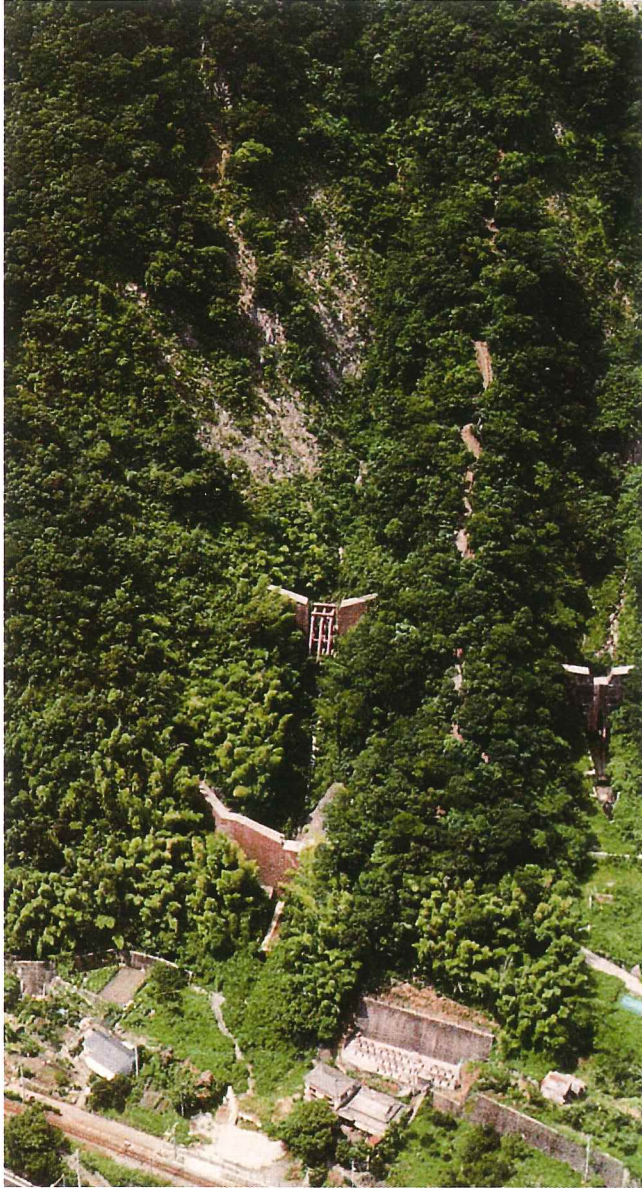
復旧後 竜ヶ水 鹿児島市 H12