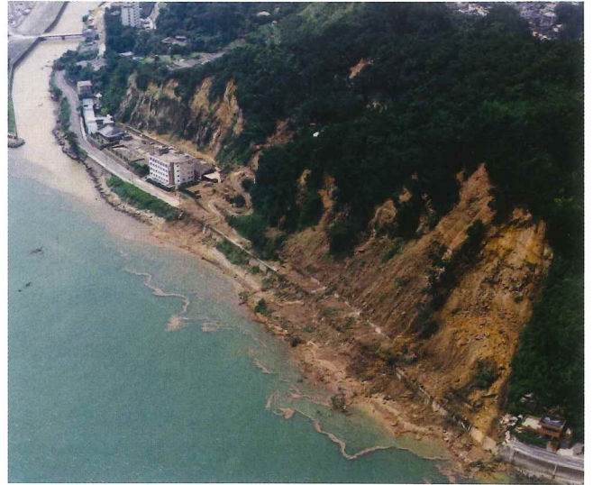
被災状況 磯 鹿児島市 H5