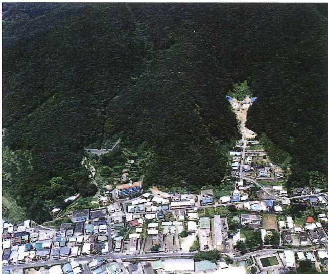
復旧後 高丘 瀬戸内町 H3