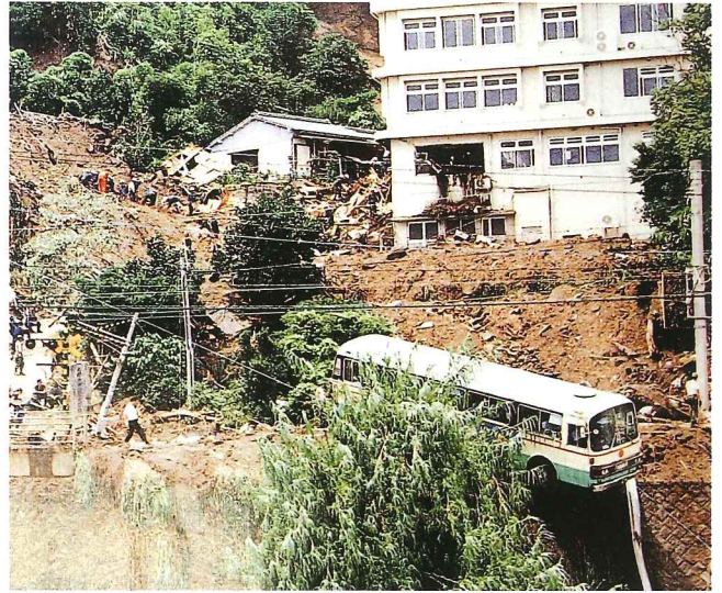
被災状況 竜ヶ水 鹿児島市 H5