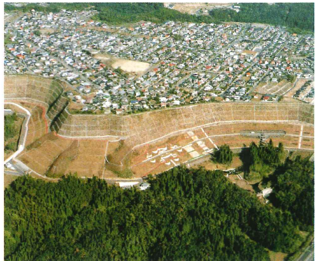
復旧後 触田 始良町 H9